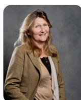
France DESJONQUERES MMB SAS Collège n°1