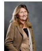
France Desjonquères MMB SAS Membre