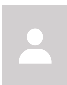
Xavier Devaux DEVAUX SASU Collège n°1